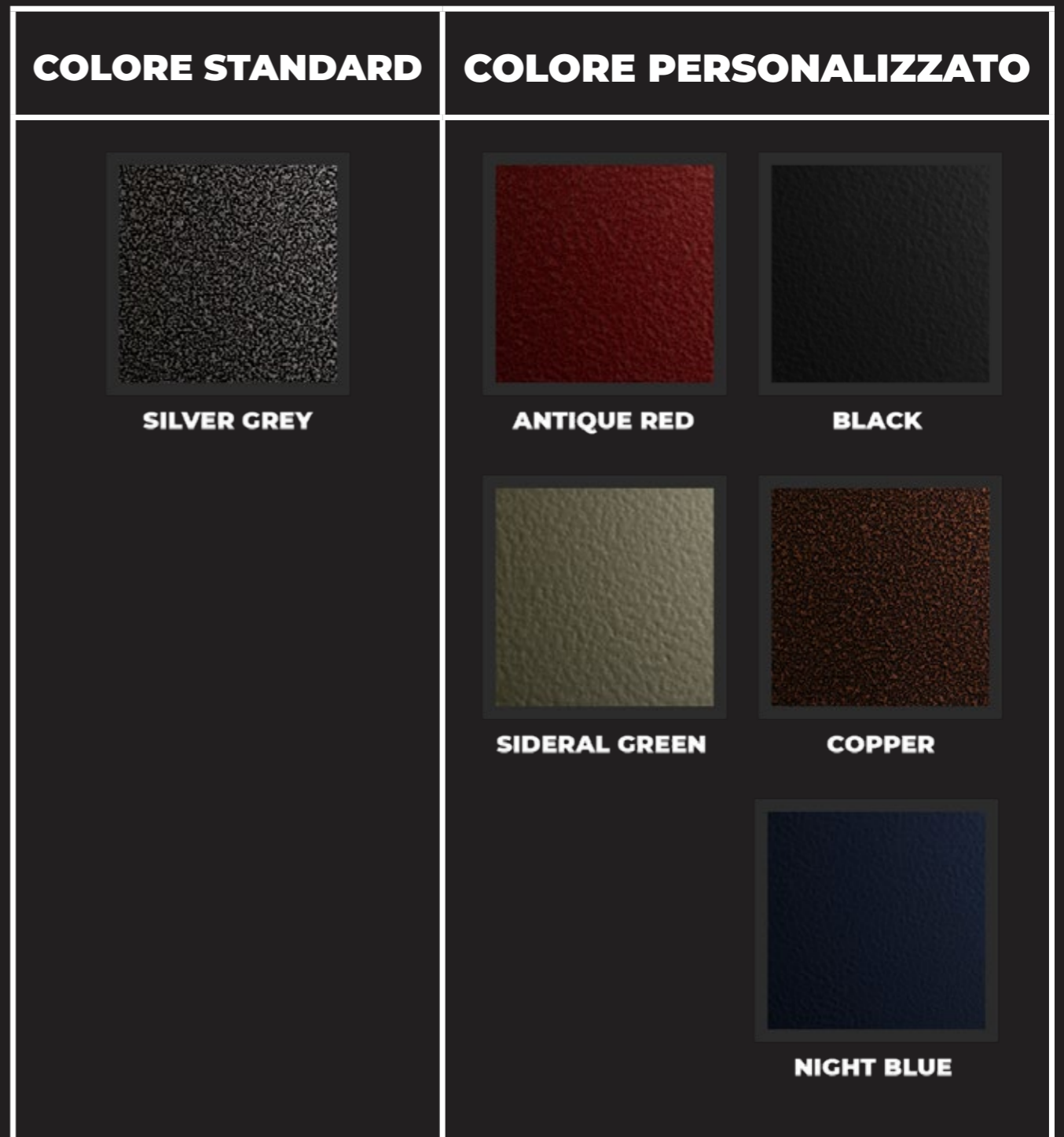
Tabella Colori Serie Quick